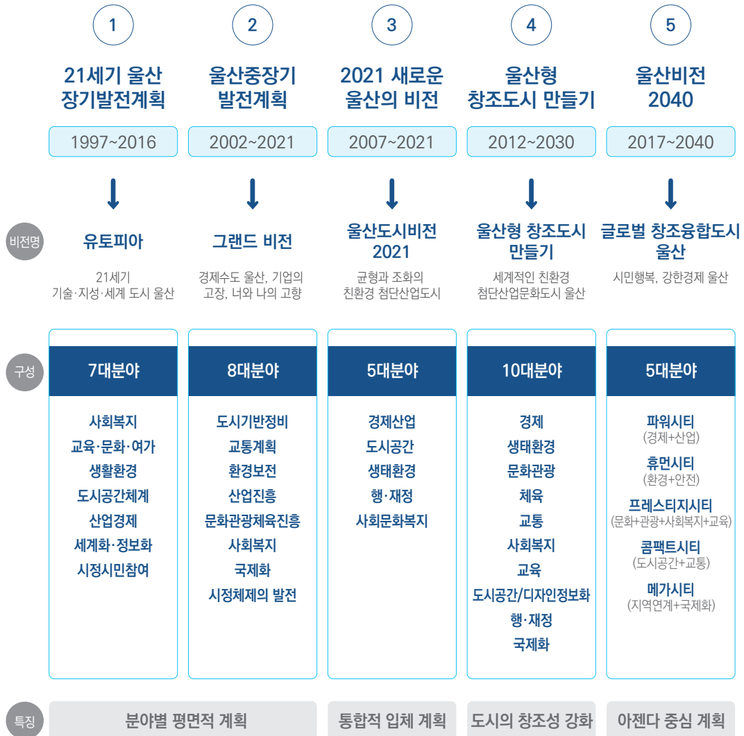
그림 2. 기존 중장기 발전계획