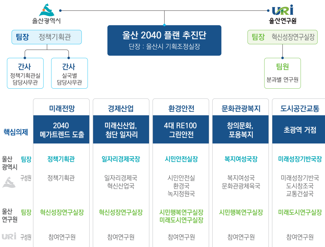
그림 1. 울산 2040 플랜 추진 체계