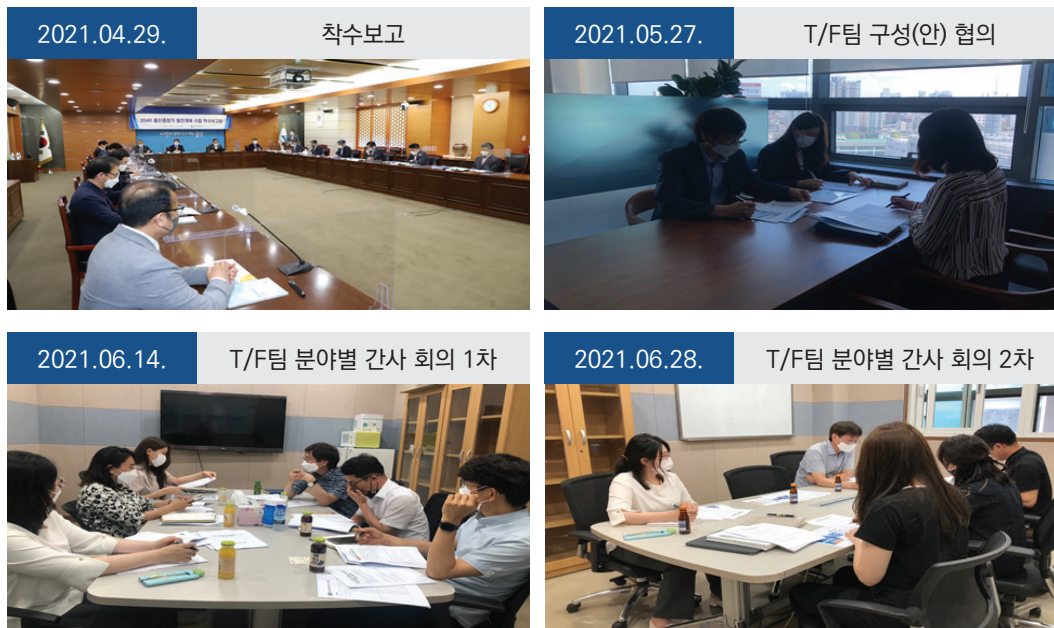
그림 3. 계획 수립의 주요 활동 사진